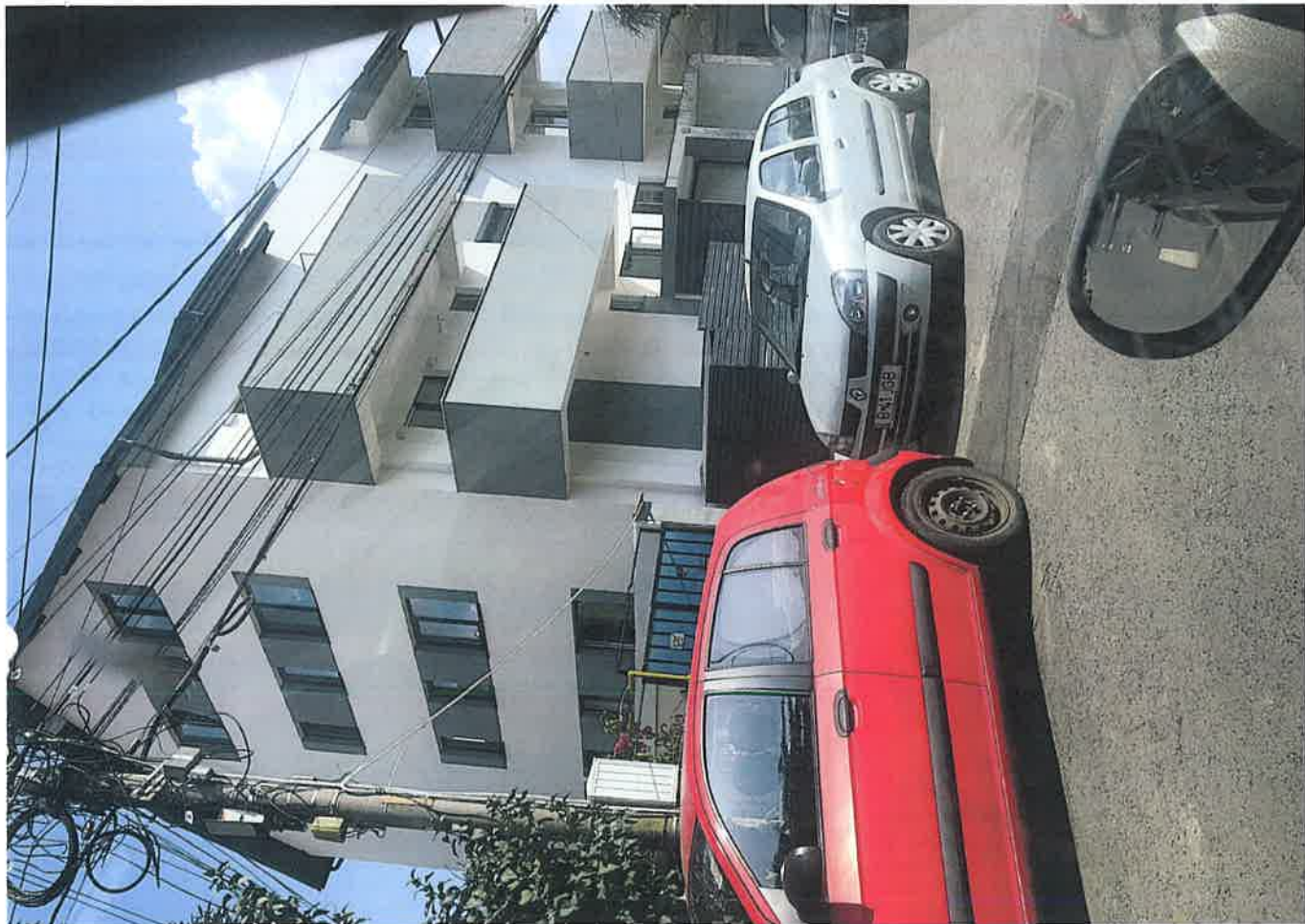
Locuințe ale pe str. Triumfalului & construite >